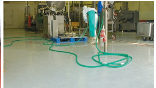
Благодаря большой толщине и применяемым высокопрочным заполнителям такие полы с легкостью выдерживают самые тяжелые механические, абразивные и ударные нагрузки

т. к. известно немало случаев, когда на гладких скользких полах персонал получал серьезные травмы и переломы.